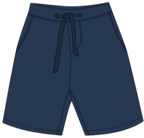
Bas (short, survêtement,...) bleu marine uni et sans motif