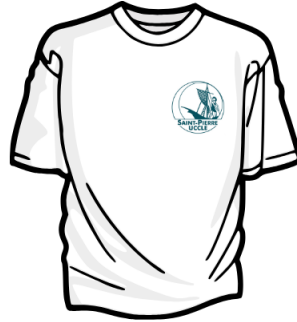
T-Shirt CSPU (achat via APSchool) ou T-Shirt blanc