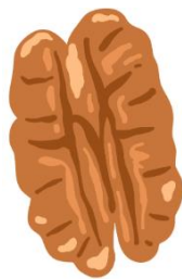
Des fruits secs