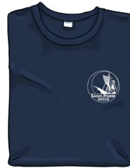
Pull, gilet ou cardigan bleu marine uni et sans motif ou pull CSPU (via APSchool)