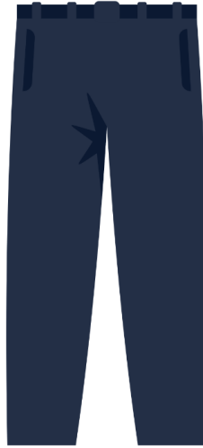
Pantalon, jupe, robe, bermuda ou short bleu marine uni et sans motif