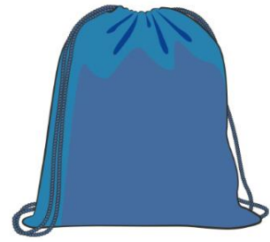
Sac de gymnastique (achat via APSchool)