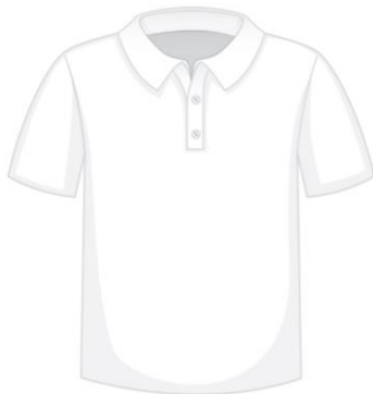
Polo ou chemise* blanc uni et sans motif *vêtement avec col